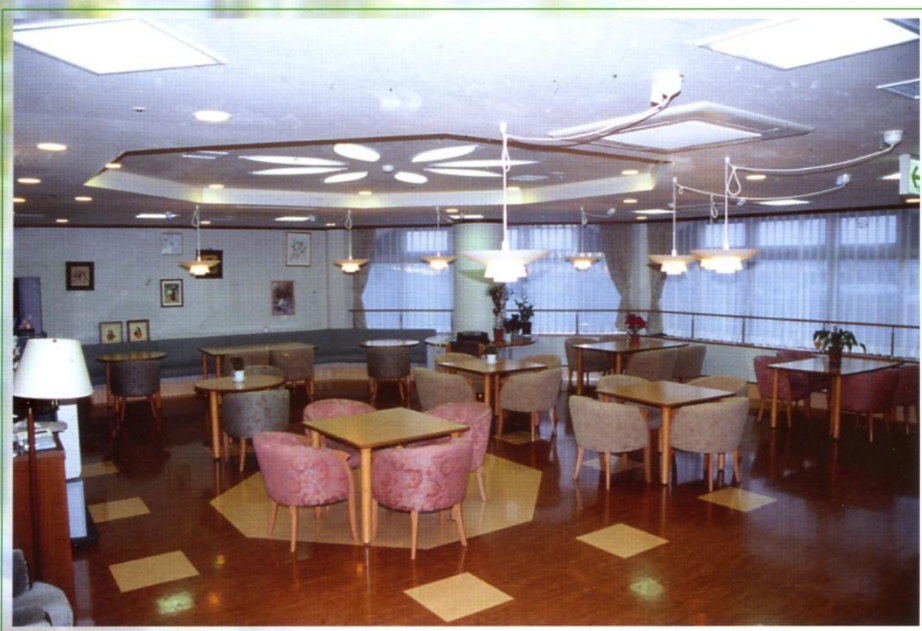
3階 食堂 (娯楽室・談話コーナー)